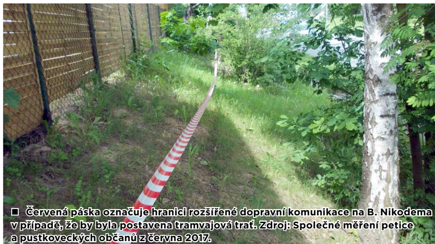
■ Červená páska označuje hranici rozšířené dopravní komunikace na B. Nikodéma v případě, že by byla postavena tramvajová trať.