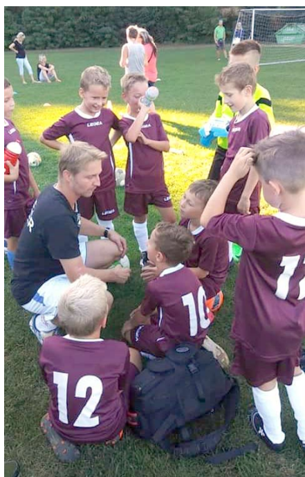
■ „Taktická“ příprava během poločasu soutěžního utkání

Vážení čtenáři Pustkoveckého zpravodaje, rádi bychom Vás prostřednictvím tohoto článku informovali o našich malých fotbalistech ve věku od 5 let do 10 let. Zájem o kopanou u těchto malých fotbalistů je obrovský. Momentálně trénujeme kolem 35 dětí, které poctivě chodí na tréninky. Mimo trénování