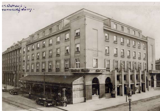
■ Kavárna Elektra a Obchodní dům Brouk a Babka

Ve vyšších kruzích se neslušelo, aby žena pracovala. Od bohatých žen se očekávalo, že se budou starat o chod domácnosti, dělat muži zázemí,