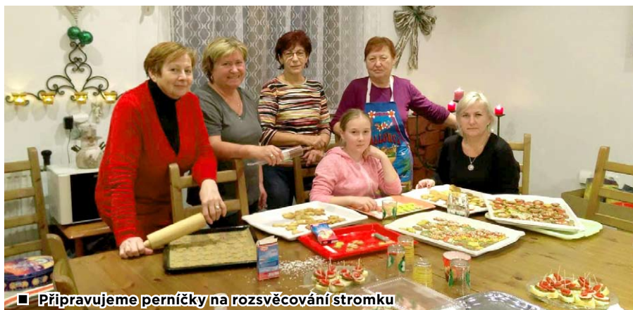
■ Připravujeme perníčky na rozsvěcování stromku