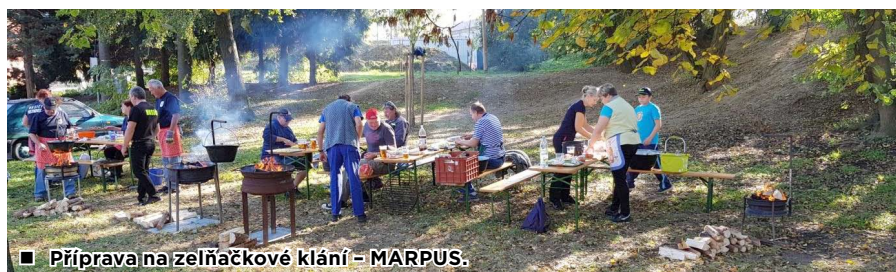
■ Příprava na zelňačkové klání – MARPUS.

Na konci září jsme využili prodlouženého víkendu a pro naše členy uspořádali zájezd do nádherného prostředí Horní Bečvy. Počasí nám nezvykle přálo a zájezd se velmi vydařil.