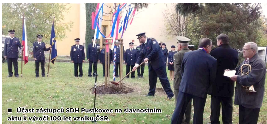
■ Účast zástupců SDH Pustkovce na slavnostním aktu k výročí 100 let vzniku ČSR.