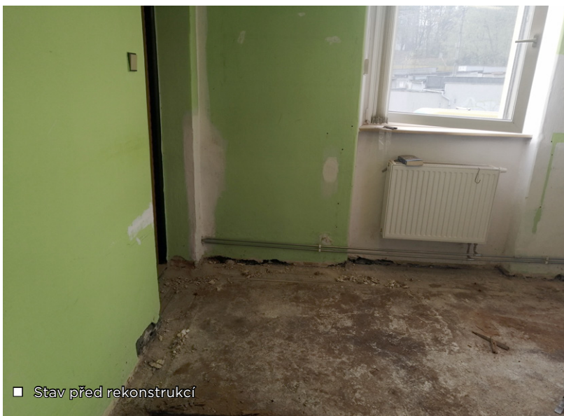
■ Stav před rekonstrukcí