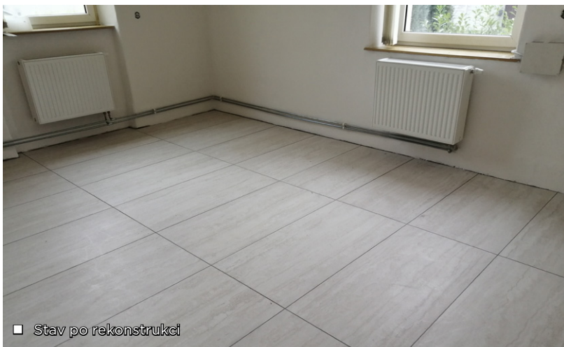
■ Stav po rekonstrukci