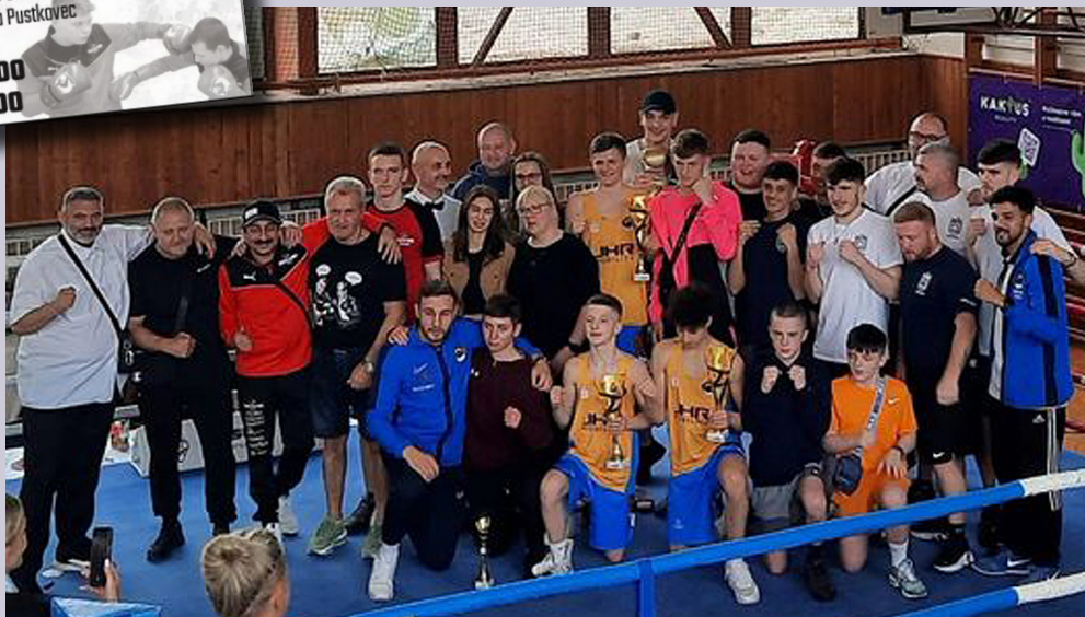
■ Na fotce borci ze Skotska, Německa a borci z Boxing klubu Poruba

Pro mladé boxeře je každý turnaj s mezinárodní účastí skvělou příležitostí, jak si zlep-