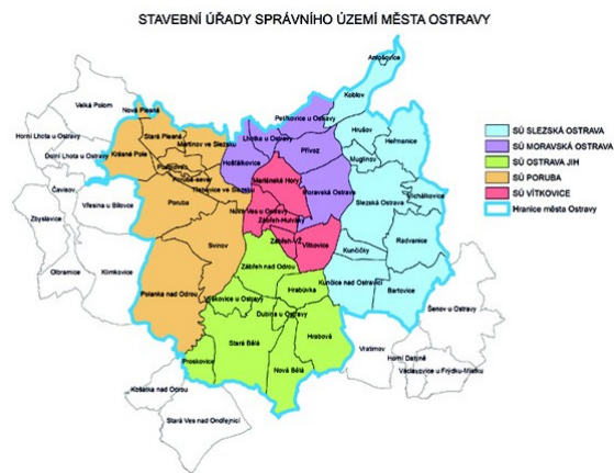
■ Mapa návrhu nové působnosti stavebních úřadů na území města. Autor: MMO

Magistrát města Ostravy je obecním stavebním úřadem, který povoluje stavby dle stavebního zákona. Některé činnosti stavebního úřadu a povolování některých staveb jsou statutem města svěřeny stavebním úřadům městských obvodů. Zde nedochází ve vazbě na nový stavební zákon k podstatným změnám. Rozsah staveb povolovaných magistrátem a městskými obvody zůstává v podstatě shodný se současným a veřejnosti známým zažitým stavem.