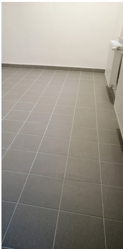
■ Rekonstruované prostory budovy MO Pustkovec pro nové využití, př. zázemí pracovní čety.