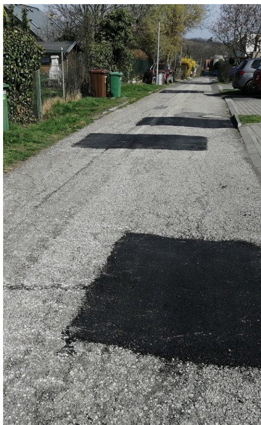
■ Opravili jsme na našich cestách výtluky po zimním období.