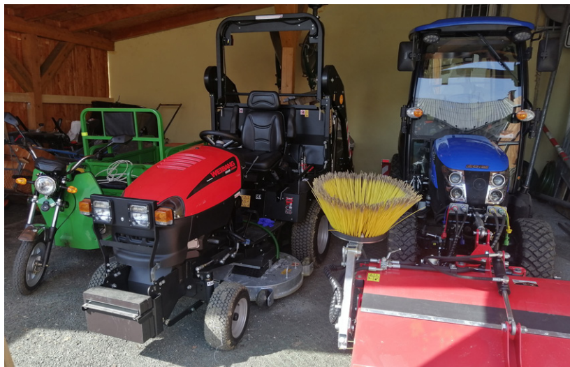
■ Techniku už máme kompletní a na novou sezónu připravenou...