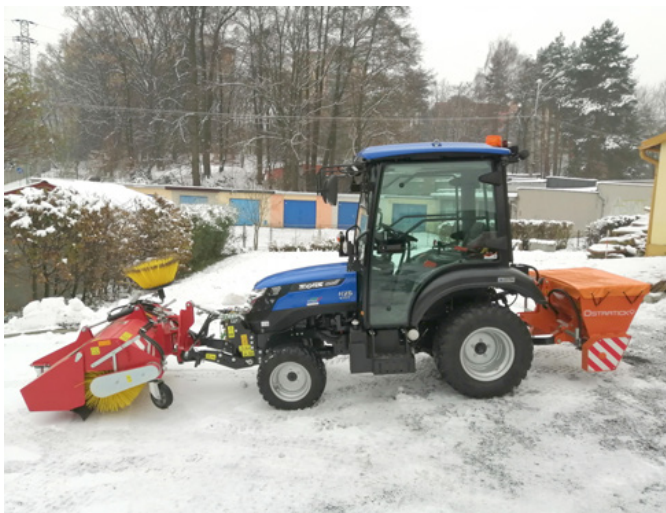
■ Traktor zakoupený z prostředků obce pomáhá také při zimní údržbě cest.