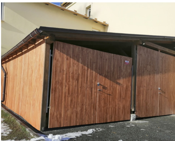
■ Nové prostory k uskladnění nářadí a strojů MO Pustkovec.