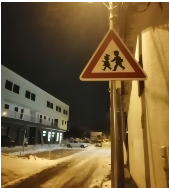
■ Nové dopravní značení na ulici Hrázka.