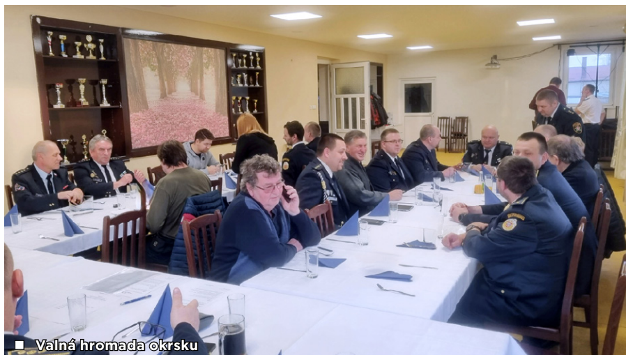
■ Valná hromada @krsku

dice hasičů při pořádání masopustního reje masek sahá až do dvacátých let minulého století a byla inspirována starými legendami a pověstmi z pohanských dob, kdy obyvatelé osad na území dnešního Slezska, kteří se živili zemědělstvím a chovem dobytka, každoročně na jaře vytáhli starého plemenného kozla do patra seníku, odkud jej obřadně shodili na zem, přičemž si zvíře zlámalo nohy, načež bylo podřezáno a obětováno božstvu za dobrou úrodu. V tomto období až do začátku druhé světové války v r. 1939 si pustkovečtí hasiči vyráběli kostýmy a KOZELEK pořádali nepravidelně, ovšem vždy podle tradičního, ustáleného programu. Od roku 1957 až do současné doby se pak KOZELEK, mimo nejtvrdíší covidový rok 2021, pořádá pravidelně. Při fraškovité popravě řezník střelí kozla prakem a zařeže dřevěným nožem. Kozel klesá, je naložen do troků a je mu uspořádán slavný pohřeb s hudbou, žehnáním kněze a nárkem všech