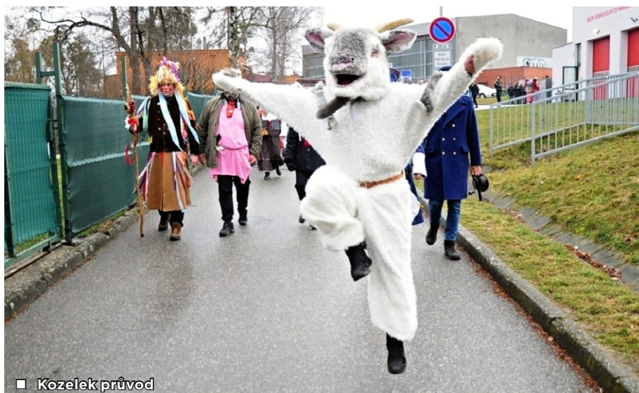
■ Kozelek průvod

účastníků. Je pochován stejně, jako se jinde pochovává basa. Na sobotní průvod jsme navázali hned v úterý 21. února, kdy jsme se zúčastnili XIV. ročníku Masopustu Ostrava, pořádaného Ostravským muzeem. Po představení masek následoval průvod centrem Ostravy a ve večerních hodinách jsme před zaplněným Masarykovým náměstím předvedli scénku zabíjení kozla. Po dvouleté pauze jsme 25. února uspořádali společenský ples Kozelek. Ples byl zcela vyprodán a atmosféra byla opravdu skvělá. Bylo vidět, že lidem tato zábava scházela, a celý ples až do brzkých ranních hodin provázela skvělá nálada. U příležitosti oslavy Mezinárodního dne žen jsme našim ženám připravili kulturně-zábavný program v hasičské zbrojnici a poděkovali jim nejen kytičkou za jejich činnost.