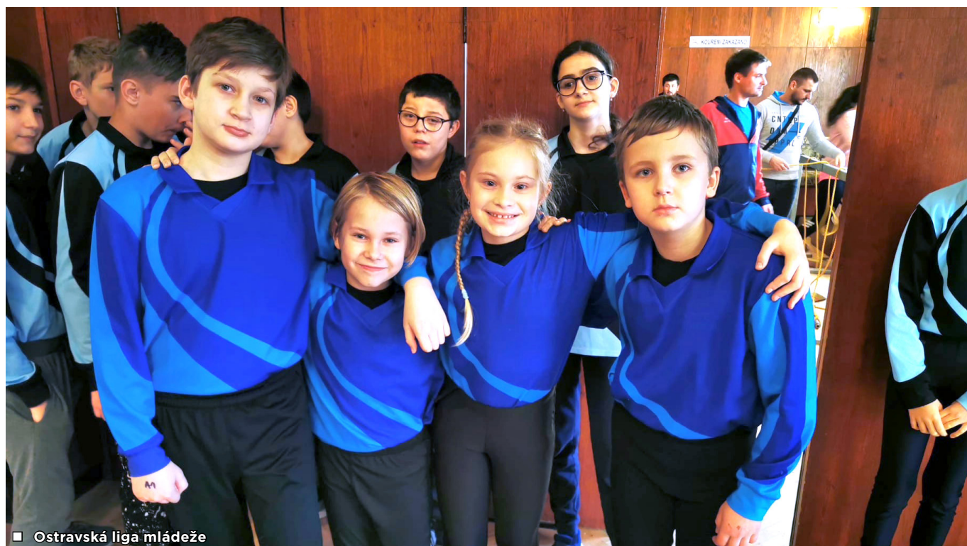
■ Ostravská liga mládeže