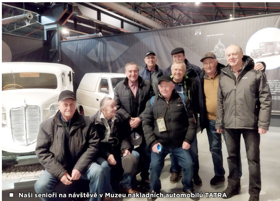
■ Naši seniori na návštěvě v Muzeu nákladních automobilů TATRA