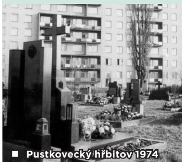
■ Pustkovecký hřbitov 1974

V roce 1964 byl pustkovecký hřbitov z důvodu výstavby VII. stavebního obvodu Poruba zrušen. Ostatky zemřelých byly přemístěny na hřbitovy okolních obcí – Plesné, Krásného Pole, Třebovic nebo Vřesiny. Dnes už hřbitov připomíná pouze pamětní deska na zatravněné ploše mezi obytnými domy. Dušičkový průvod je plánován na 2. listopadu 2020.