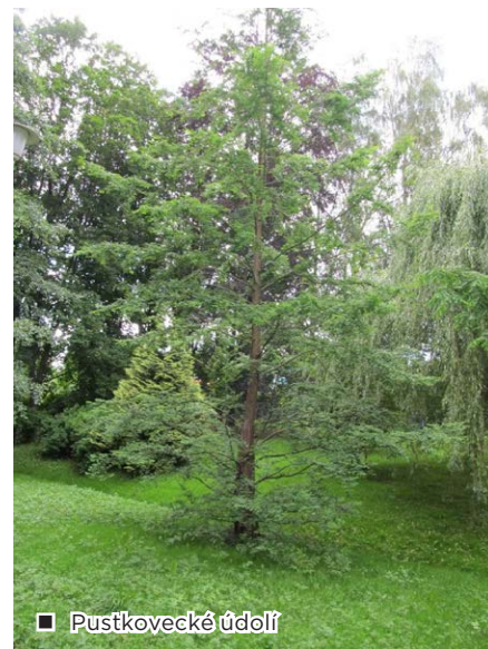
■ Pustkovecké údolí

doplňují plánovaný projekt a rada Mo Pustkovec doufá že se revitalizace v blízké době uskuteční, protože současný stav dlouhodobě zanedbávaného údolí to již vyžaduje.