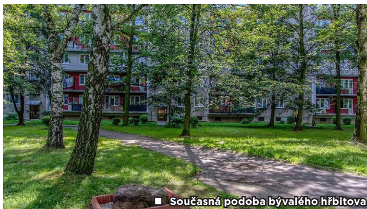
■ Současná podoba bývalého hřbitova