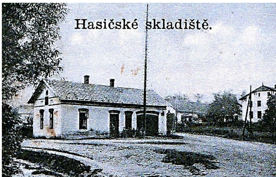
■ HASIČSKÉ SKLADIŠTĚ - 1930

Do roku 2019 využívala budovu staré hasičské zbrojnice Jednotka sboru dobrovolných hasičů Pustkovec. Nyní se však sbor přesídlil do hasičské zbrojnice nové a stará budova zůstala opuštěná. Městský obvod si ji hodlá ponechat ve své správě a poskytnout její prostory spolkům a jiným dobrovolným organizacím k jejich činnosti.