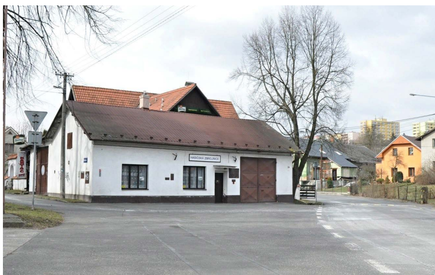
■ HASIČSKÁ ZBOJNICE - 2018