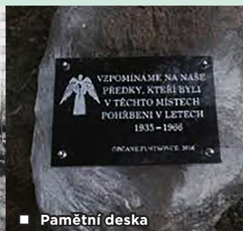
■ Pamětní deska